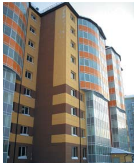
Общежитие, г. Ноябрьск

ООО «СК ФЕЛИКС» оказывает инжиниринговые услуги по сбору исходных данных и разрешительных документов для начала проектирования и строительства. В рамках архитектурного проектирования осуществляется предпроектная проработка и подготовка, создаются эскизы, утверждается основной проект и собирается вся необходимая документация.