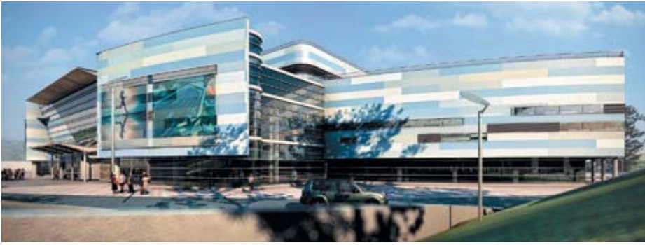
Зона активного отдыха (2 этап), г. Ноябрьск