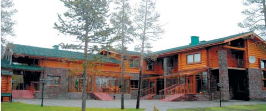
Оздоровительно-реабилитационный центр ООО «Газпром добыча Ноябрьск», г. Ноябрьск

В рамках дизайн-проекта предоставляется целый комплекс услуг, начиная с обмера помещений и заканчивая подбором мебели, аксессуаров и предметов декора интерьера. При этом учитывается функциональное назначение объектов.