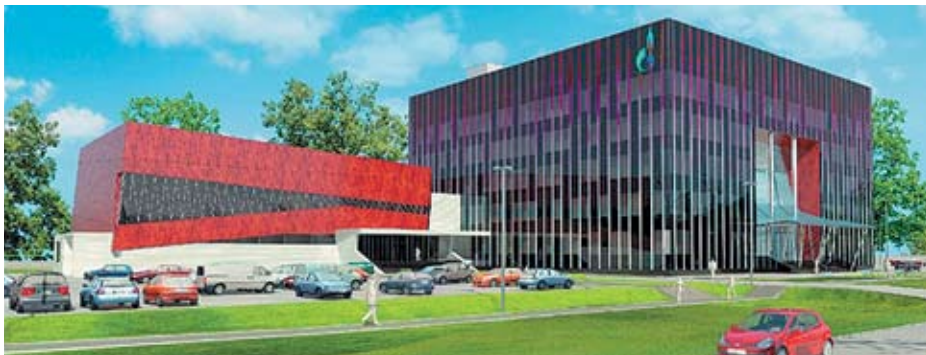
Проект административно-бытового комплекса ООО «Газпром добыча Ноябрьск», г. Ноябрьск

Российско-Белорусская компания «ФЕЛИКС» работает на строительном рынке с 1992 года. Из небольшого архитектурного бюро компания превратилась в мощную и современную проектно-строительную организацию, предлагающую потребителю весь комплекс услуг от концепции проекта до завершенного «под ключ» объекта. За 19 лет деятельности портфолио компании пополнилось десятками объектов строительства и проектирования, многие из которых возведены на территории Крайнего Севера и Сибири.