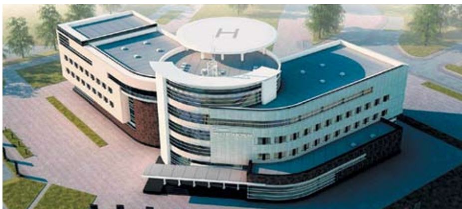
Проект административного здания ООО «Севернефтегазпром», г. Новый Уренгой

В России предприятие представлено строительной компанией ООО «СК ФЕЛИКС», которая по праву может называться профессионалом в области проектирования, управления архитектурными проектами и производства строительно-монтажных работ. Сегодня основные направления деятельности компании — это строительство новых зданий, благоустройство, ремонт и реконструкция административных и жилых объектов, инженерных сооружений, инжиниринг в строительстве, проектирование, возведение новых зданий, цифровое моделирование объектов, оптовая и розничная торговля строительными изделиями и материалами.